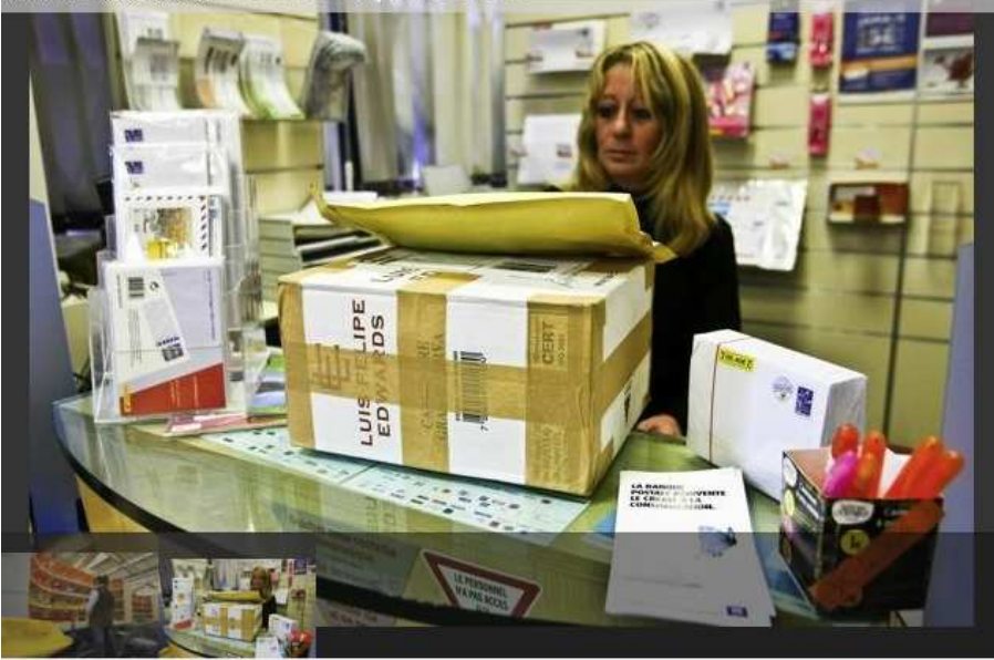
Vignettes | Diaporama | Plein écran