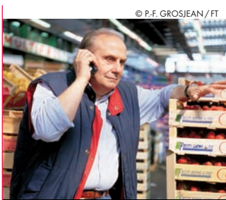
Un opérateur de plus dans un marché déjà saturé...

L'ARCEP (*) a retenu la candidature de Free Mobile, unique candidat à la quatrième licence de téléphone mobile en France. Pour FO Communication,