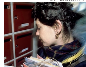
L'IRCANTEC veut conserver les postiers, présents et à venir

Lors de sa séance du 17 décembre 2009, le Conseil d'administration de l'IRCANTEC a adopté, à l'unanimité des votants, une motion revendiquant le maintien de La Poste dans son périmètre. En effet, alors que la réforme des paramètres de l'IRCANTEC adoptée fin 2008 vise à assurer l'équilibre à long terme du régime, la sortie du périmètre de l'IRCANTEC des salariés futurs de La Poste remettrait en cause cet équilibre et compromettrait la pérennité du régime.